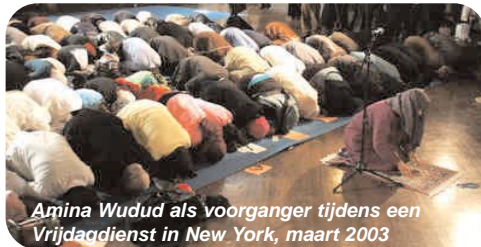
Amina Wudud als voorganger tijdens een Vrijdagdienst in New York, maart 2003