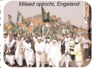
Milaad optocht, Engeland

Openbare vieringen van de Milaad un-Nabi vonden pas plaats zo'n 400 jaar na het overlijden van de Profeet. Deze vieringen waren oorspronkelijk een festijn van de Shia Moslims. De eerste officiële herdenking van Milaad un-Nabi vond plaats in de elfde eeuw n.C. in Egypte. De viering verspreidde zich geleidelijk aan over de gehele wereld.