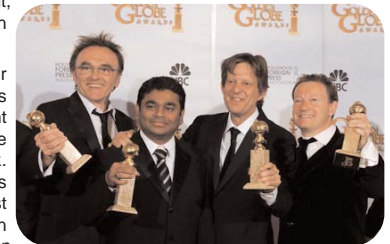
A.R. Rahman (tweede van links) tijdens de uitreiking van de Golden Globe Award. De film 'Slumdog Millionaire' sleepte vier hoofdprijzen in de wacht.

De Indiase music director en zanger A.R. Rahman is wereldberoemd. Hij bracht een revolutie teweeg in de Bollywood muziek. Onlangs won hij - als eerste Indiase componist in de historie - in Hollywood de Golden Globe Award voor de beste originele music score in de film 'Slumdog Millionaire'.