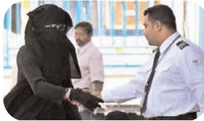
Michael Jackson (links) in Bahrein, waar hij enige tijd heeft gewoond

Deze woorden sprak Muhammad Abdul Aziz (Jermaine) Jackson uit kort na het overlijden van zijn jongere broer Michael, die op donderdag 25 juni j.l. de geest gaf. De uitspraak deed eens te meer de vraag rijzen of Michael de Islam als religie had aangenomen. "Toen ik terugkwam uit Mekka heb ik hem een heleboel boeken gegeven en hij heeft me een heleboel over mijn geloof gevraagd en ik hem verteld dat het vreedzaam en prachtig is", aldus Jermaine, die zelf sinds 1989 Moslim is. Als het aan hem ligt, wordt Michael met een Islamitische ceremonie ten grave gedragen.