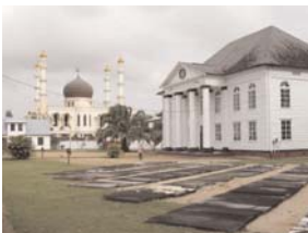
Een moskee en een synagoge, vreedzaam naast elkaar aan de Keizerstraat in Paramaribo, Suriname

Eerder deze week hebben wij in Surinaamse dagbladen artikelen van diverse auteurs gelezen, die van mening zijn dat de emancipatieviering van zeer groot belang is voor de Creoolse Surinamers. Correct. Weinigen zien echter in dat 1 juli ook voor andere bevolkingsgroepen een belangrijke dag is. Het is immers de afschaffing van de slavernij geweest, die het noodzakelijk maakte dat later werkers uit andere werelddelen naar Suriname werden getransporteerd om op de plantages te arbeiden. Vanaf toen kregen we in Suriname de Hindostanen, Javanen, Chinezen en nog veel meer bevolkingsgroepen.