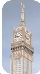
Mecca Clock Tower

De klok zal in ieder geval veel bekijks hebben omdat het staat in een gebied waar ook hotels, malls en conferentiezaal komen.