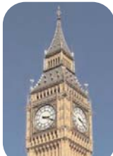
Big Ben, Engeland

Islangeleerden zijn van mening dat de klok de Greenwich Mean Time als standaard zou moeten vervangen, omdat naar hun mening Mekka een