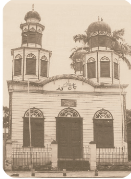
De eerste stadsmoskee van de S.I.V., Keizerstraat

Dat met deze groep de eerste Moslims naar Suriname kwamen, is echter niet helemaal juist. Ten eerste kan worden aangehaald dat een deel van de slaven die uit Afrika werd aangevoerd de Islam aanhing, maar de Europese kolonistators stonden hen niet toe om vrijelijk hun religie en cultuur te belijden. Ten tweede is het zo dat reeds voor de Hindostaanse immigratie in 1873 er Moslims naar Suriname kwamen, die uit India naar omliggende landen (zoals Guyana) waren gehaald en van daaruit na hun contractperiode naar ons land verhuisden. Deze eerste groepen van Moslims zijn echter van weinig betekenis geweest bij de vestiging van de Islam in Suriname. Vandaar dat het begin van de Hindostaanse immigratie in 1873 over het algemeen als startpunt wordt gehanteerd voor wat betreft de vestiging van de Islam hier te lande.