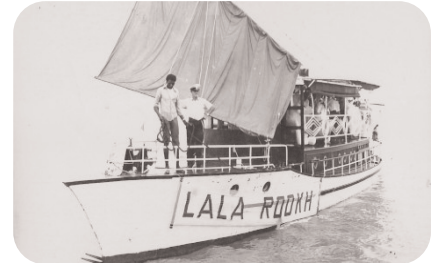
Aankomst nagebootste 'Lalla Rookh' op Nieuw Amsterdam