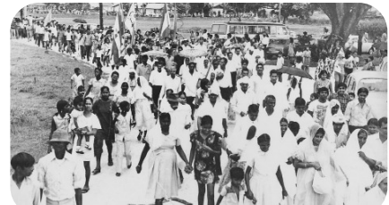
Lange optocht vanuit de steiger naar Nieuw Amsterdam. Grote massa mensen op de been