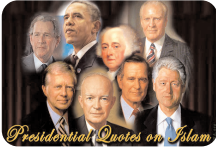
Presidential Quotes on Islam