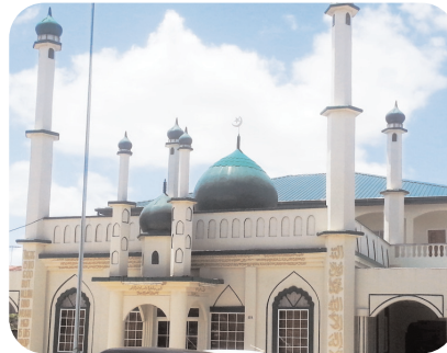
Foto: de Imdadia moskee aan de Indira Gandhiweg met de nieuw gebouwde zaal op de achtergrond

Het bestuur van Imdadia hoopt als volgend groot project de moskee te renoveren en moderniseren naar hedendaagse maatstaven, waarbij de historische karakteristieken van het bouwwerk behouden zullen blijven. Hiertoe is reeds een commissie samengesteld.