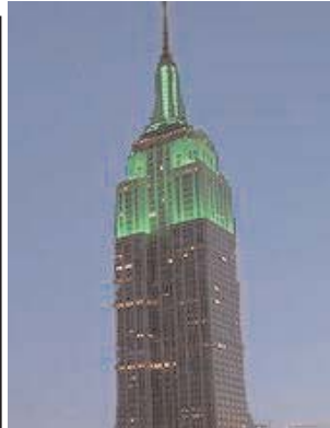
In verband met led ul-Fitr 2007 was de top van de Empire State Building in de U.S.A. verlicht met groene verlichting.