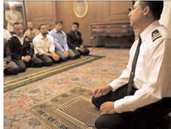
Ramadan gebed in het Pentagon (U.S.A.). Ongelooflijk maar waar.

Studie van de Schepping is het begin van een lange reis die de relatie tussen mens en Schepper verdiept. Uiteindelijk zijn het volgens de Koran zelfs uitgerend de geleerden die zich meest bewust zijn van de Almacht van God: "God wordt slechts gevreesd door de geleerden onder Zijn dienaren. God is machtig en vergevend" (Koran 35:28).