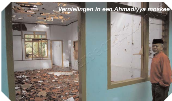
Vernielingen in een Ahmadiyya moskee

Enkele weken geleden heeft een onderzoeksteam van de Indonesische overheid, op aandringen van Moslimextremisten, het advies uitgebracht aan de overheid om de Ahmadiyya's tot non-Moslim te verklaren onder de beschuldiging van "het schaden van de godsdienst", waarop een maximale straf van 5 jaar staat. In aansluiting hierop zijn de ministeries van Religieuze Zaken en van Binnenlandse Zaken, samen met de Procureur-Generaal, doende een decreet samen te stellen om deze Moslimgroepering buiten de Islam te plaatsen. Deze kwestie heeft reeds tot veel geweld geleid, waaronder het vernielen van moskeeën van de Ahmadiyya's in Indonesië.