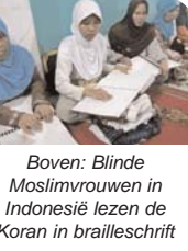
Boven: Blinde Moslimvrouwen in Indonesië lezen de Koran in brailleschrift

Foto rechts: Imam W.D. Mohammed (rechts) en de toenmalig wereldkampioen boksen Muhammad Ali tourend door Paramaribo. Op de achtergrond is nog net het naambord 'Torarica' te zien.