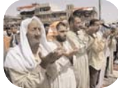
Foto: In Irak hebben vele Sunni's en Shia's besloten hun sectarische verschillen terzijde te leggen en samen hun Ramadan door te brengen.